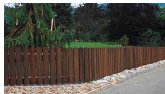
Breitstaketen braun imprägniert, mit Metalltraversen