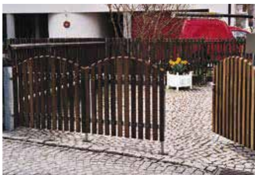
Staketentor dreiflügelig, mit Stahlrahmen

Es würde zu weit führen, an dieser Stelle auf alle technischen Möglichkeiten einzugehen, die der Staketenzaun bietet. Rufen Sie uns einfach an, oder senden Sie uns einen Fax bzw. ein E-Mail, damit wir Ihnen ein individuelles, für Sie unverbindliches Angebot unterbreiten können.