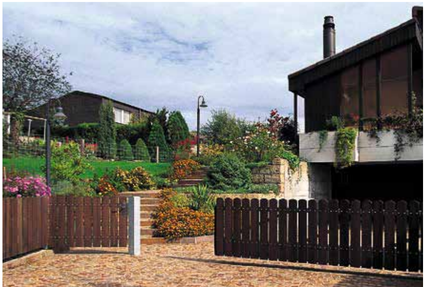
Freitragendes Konsolschiebetor und Servicetüre

Erfolgt die Ausführung mit Metalltraversen, so beträgt die Pfostendistanz zwei Meter. Staketen aus Tannen- oder Lärchenholz sind 26 oder 20 mm stark, allseitig gehobelt und in verschiedenen Breiten lieferbar. Ihre Befestigung geschieht mit rostfreien Schlossschrauben. Die Staketenabstände können beliebig gewählt werden. Sämtliche Metallteile sind verzinkt. Das Holz wird im Vakuum-Druck-Verfahren imprägniert. Die preisgünstigere Variante des Staketenzauns ist diejenige mit Holztraversen und aufgenagelten Staketen. Statt der Ausführung mit Metallpfosten kann auch eine solche mit Lärchen- oder Eichenpfosten gewählt werden.