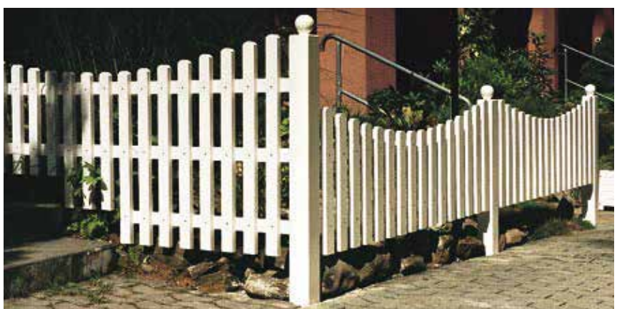
Staketenzaun geschweift, weiss gestrichen