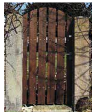
Staketentüre mit Holzrahmen