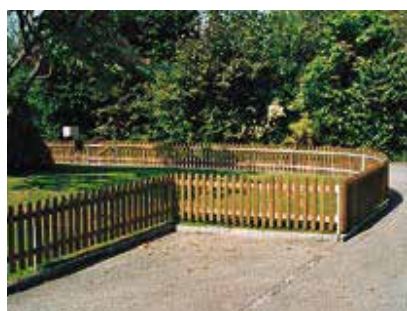
Staketenzaun grünlich imprägniert, mit Holztraversen