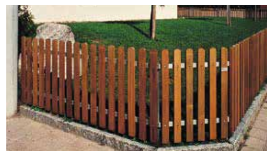
Staketenzaun lasiert, mit Metalltraversen