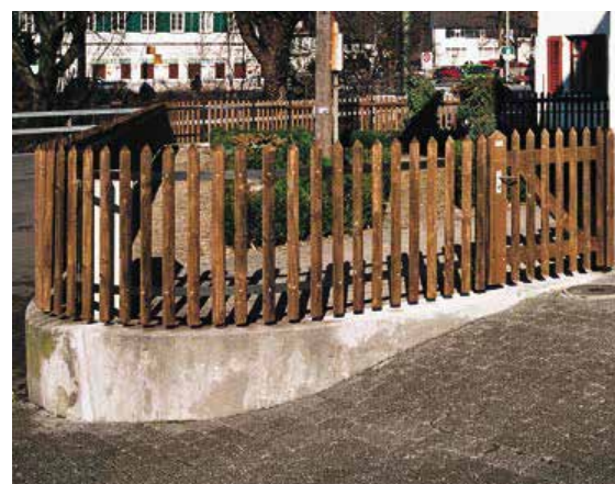
Palisadenzaun / Bogen mit Metalltraversen

Die Massangaben zu den einzelnen Positionen differieren je nach Zaunhöhe. Beachten Sie dazu bitte die untenstehende Tabelle.