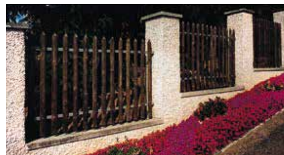
Palisadenzaun mit Metalltraversen