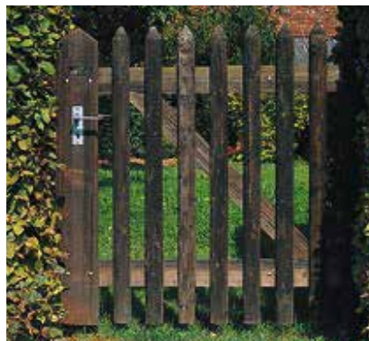
Palisadenzaun mit Holzrahmen

Den Palisadenzaun liefern wir in Tannenholz. Die Traversen sind normalerweise aus Tannenholz halbrund, zylindrisch geschält; diejenigen aus Lärchenholz sind kantig, gehobelt. Die Palisaden werden mit Spezial-Rillenstiften vertikal aufgenagelt. Wird auf besondere Dauerhaftigkeit Wert gelegt, so können Pfosten und Traversen aus feuerverzinktem Metall gewählt werden.