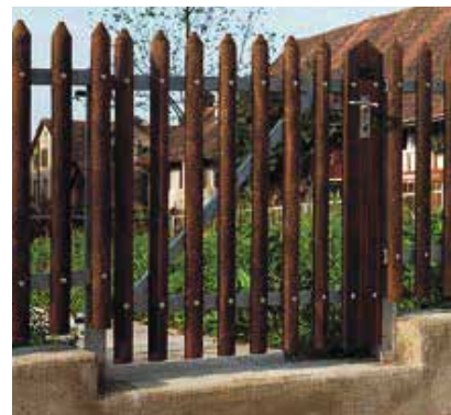
Palisadenzaun mit Metallrahmen