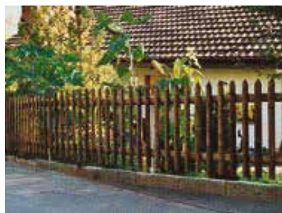
Palisadenzaun mit Holztraversen